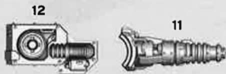
Hull Mounted neutron blaster