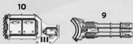
Hull Mounted Anvilus autocannon